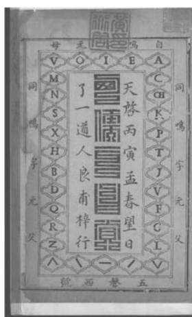
Frontespizio del volume Liè biān zhèng pǔ dell'edizione del 1626.

tratta di un'opera peculiare per molti aspetti, di un lavoro a più mani, dove il ruolo dei collaboratori cinesi non fu quello di revisione stilistica ed editoriale, ma di veri e propri co-autori.